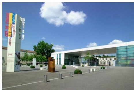
Musée de l'image